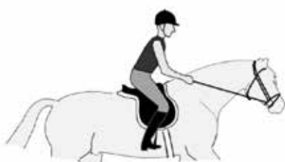
De verlichte zit.