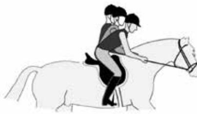
Varianten in de verlichte zit.