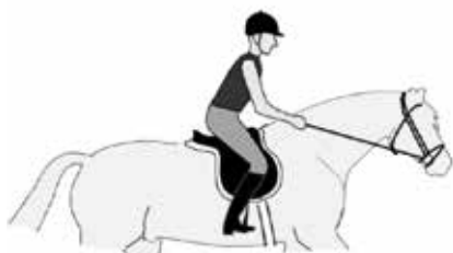
De verlichte zit.