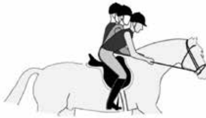
Varianten in de verlichte zit.