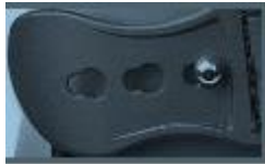
Pinsluitingen: Sluitingen met een flap welke over een uitstekende pin past.

Bij achterbeen bescherming zijn alleen de volgende 2 type sluitingen zijn toegestaan: