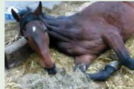
Merrie met EHV-1 kan niet meer staan, maar drinkt en eet nog volop.